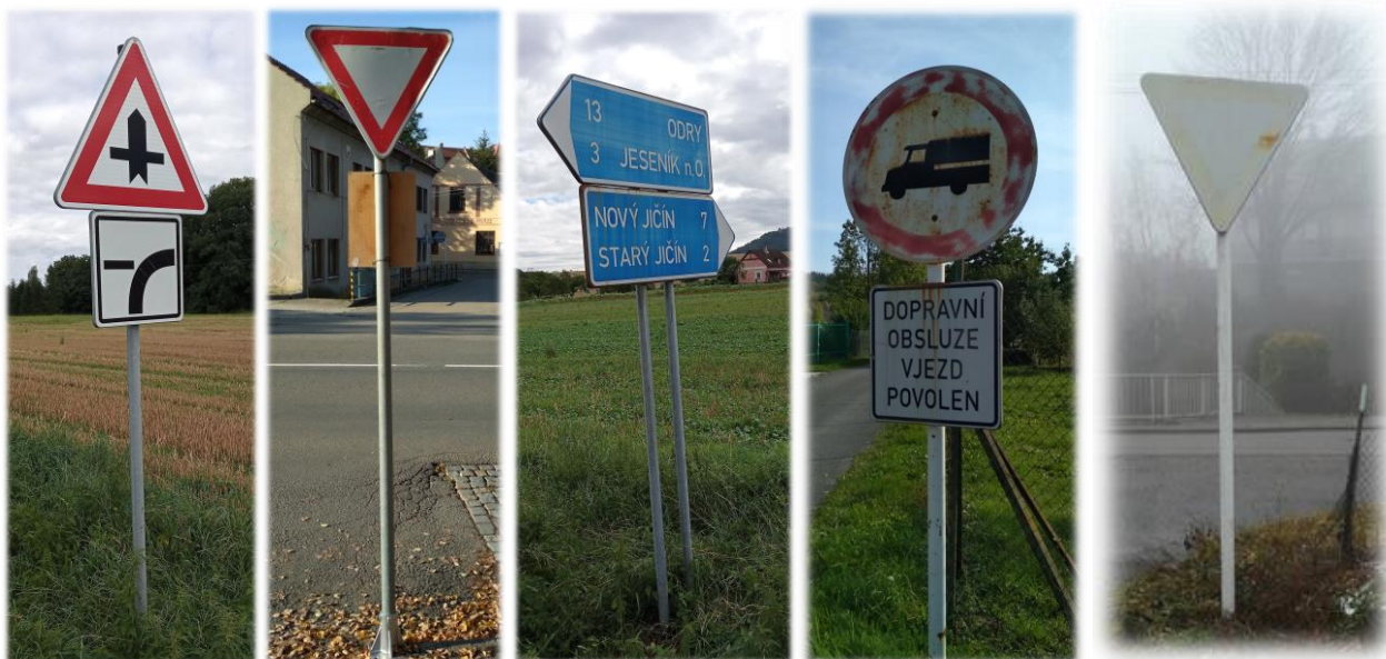
Obr. 1 Příklady dopravních značek dle stavu 1 – 5